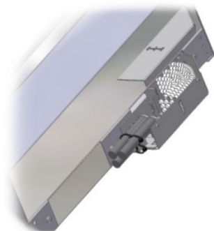
Optional, Bündeladeraufteiler (max. 144 Fasern)